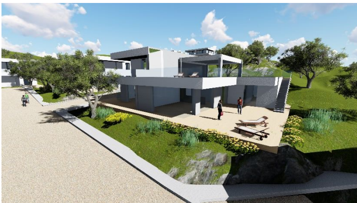
Progetto (con altro professionista) e calcoli asismici per la costruzione di n. 20 unità immobiliari in Messina, c.da Sperone. (Permesso di costruire convenzionato). In corso di approvazione. 2019