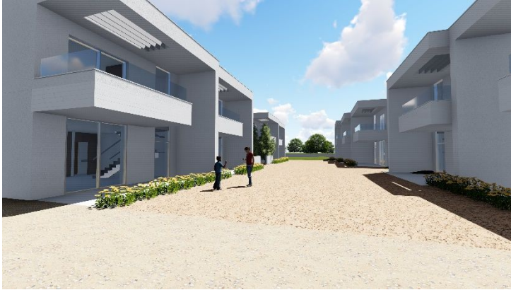
Progetto di 9 u.i. in Mascali CT – 2018 -