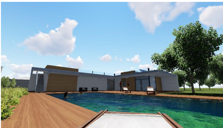
Progetto d.l. , impiantistica, strutture – villa B&B in Mascali. 2018-

Microsoft office con certificazione “microsoft office specialist user” excel livello expert.